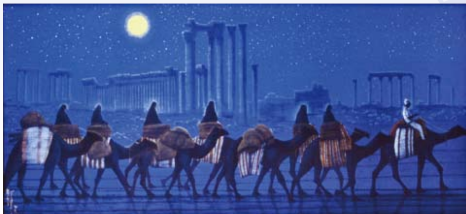
パルミラ遺跡を行く夜

戦後美術史に大きな足跡を残した平山郁夫画伯は、日本文化の源流を求めてシルクロード、東西文化交流の道を訪ね歩きました。50年以上にわたる旺盛な創作活動と、文化史跡の保護にあたる社会活動は、美術界のみならず、日本をはじめ世界の文化や社会に大きな影響を与え続けました。ユネスコ親善大使として世界平和にも貢献され、2009年12月2日にご逝去されました。享年79歳でした。